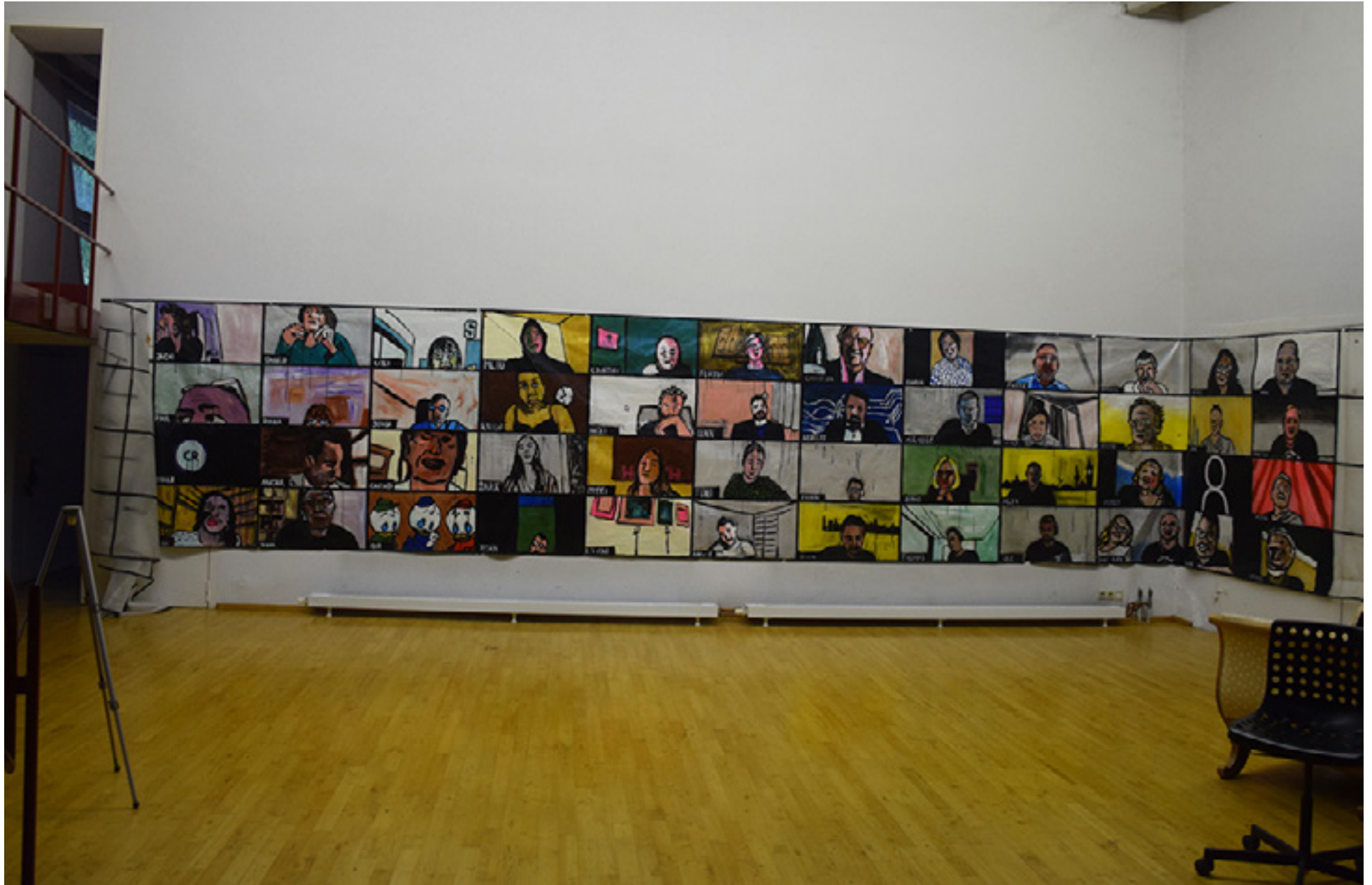
meeting 2021/2022, Acryl Folie 183 x 1100 cm, bemalt insg. 1500 x 183 cm. rollbar und erweiterbar